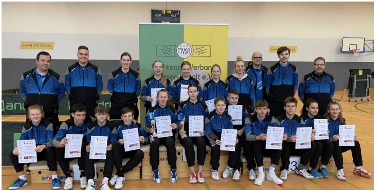
Nachwuchskadergruppe bei den Mitteldeutschen Meisterschaften 2023

Bereich der Nachwuchs- und der Mitgliedergewinnung durchzuführen. Mit dem „TTVSA – Talente Nest“ unterstützen wir erfolgreiche Vereine bei Ihrer Nachwuchsarbeit.